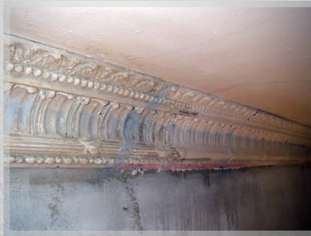
Mehringdamm, Innenstuck, Ausführungszeitraum 4 Wochen