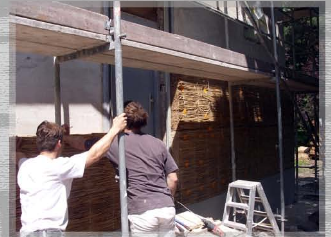
Wandalenallee Lehmputz, Schilfrohrdämmung