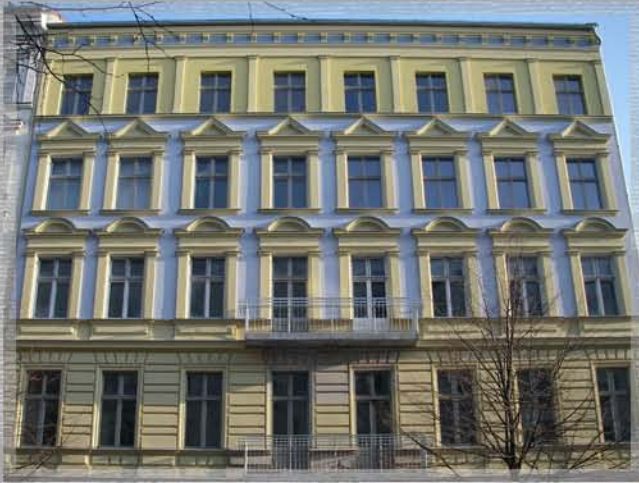
Marienburger Strasse 47, ca. 3 Monate