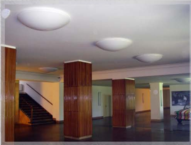
Nalepastrasse, Altes Rundfunkgelände, Ausführungszeitraum ca. 6 Wochen