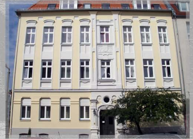
Körnerstrasse 38, ca. 6 Wo