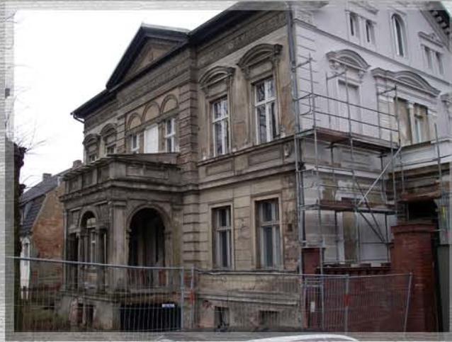
Werneuchen, in Ausführung Husemannstrasse 6, ca. 6 Wo