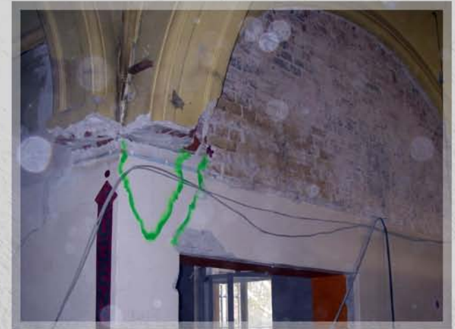
Soorstrasse, ca. 1 Woche, Budhistisches Begegnungszentrum